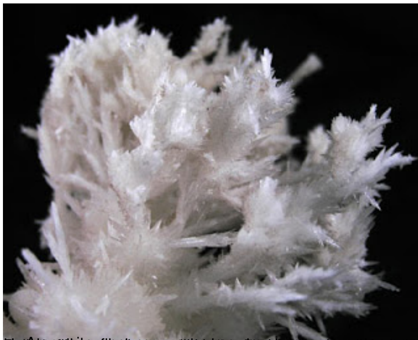
Ureja kristalizira u obliku iglica, koje su u prirodi najčešći kristalni oblik ovog jedinjenja.